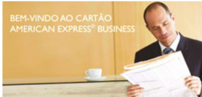
Cartão American Express® Business O cartão de crédito para as Empresas de sucesso